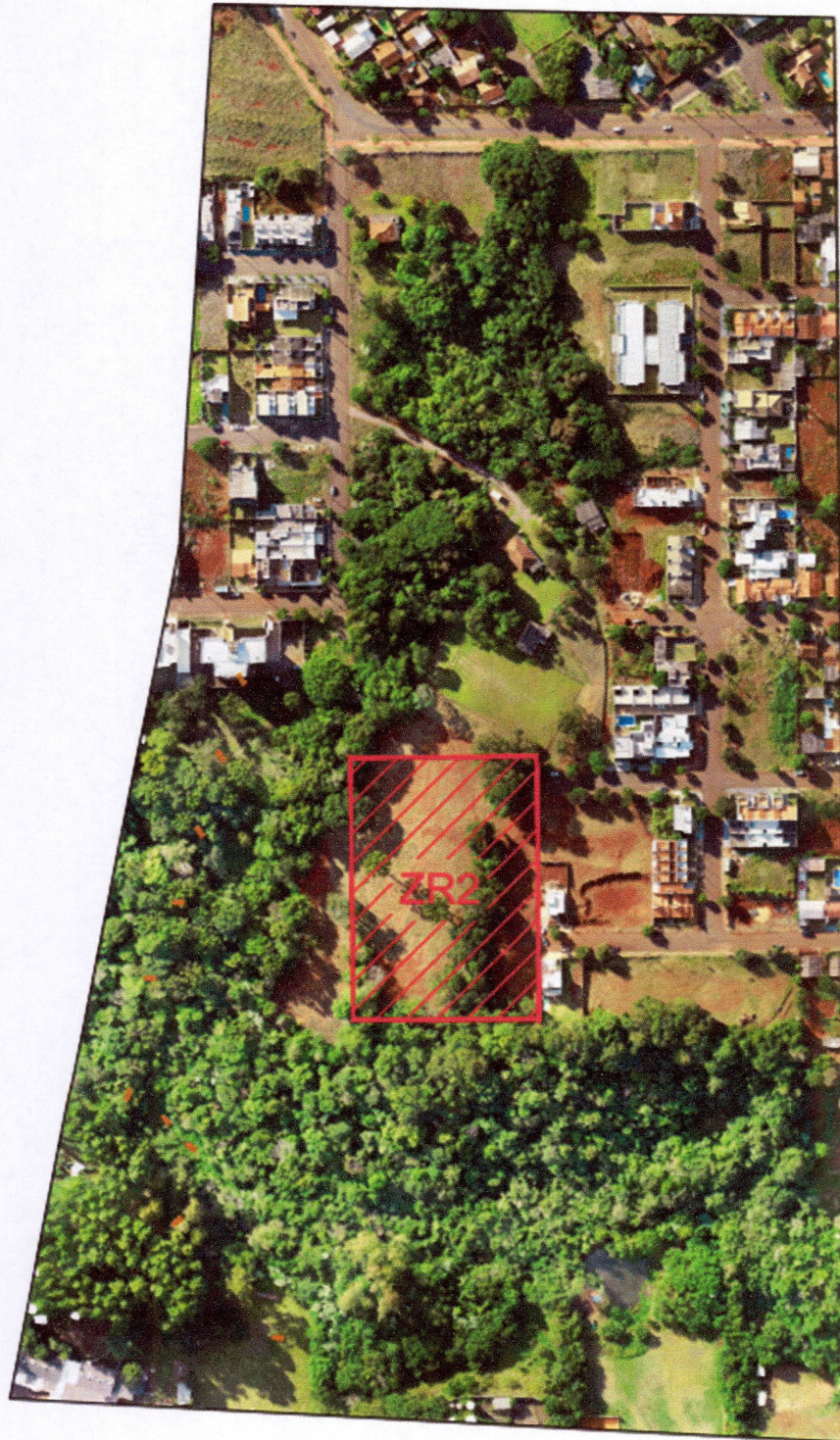
Imagem 02: Área com zoneamento de interesse.

Ferronato Engenharia e Empreendimentos – ME Rua Ledoíno José Biavatti, 1740, Vila Industrial, Toledo/PR (45) 3054 - 2969 (45) 9954 - 0109