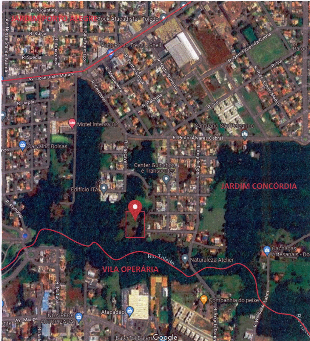
Imagem 01: Região de localização da área de interesse dentro do município.