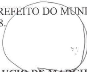
LUCIO DE MARCHI PREFEITO DO MUNICÍPIO DE TOLEDO

GABINETE DO PREFEITO DO MUNICÍPIO DE TOLEDO, Estado do Paraná, em 19 de outubro de 2018.